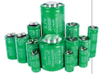
Supercondensateurs utilisés dans les éoliennes.

Les supercondensateurs sont utilisés dans les démarreurs des trains, les systèmes d'orientation des pales d'éoliennes ou pour alimenter le dispositif de redémarrage automatique d'un moteur. Leur excellente réactivité promet une utilisation de plus en plus fréquente pour stocker temporairement et à grande échelle les surplus d'énergie électrique issus des sources renouvelables.